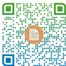
(กรุณาคลิก/สแกน) แบบลงทะเบียน

๓.๑ โรงเรียนที่สนใจส่งตัวแทนนักเรียนของโรงเรียนเข้าร่วมการแข่งขัน จะต้องกรอกข้อมูลในการสมัครได้ที่ แบบลงทะเบียนเข้าร่วมการแข่งขันทักษะทางวิชาการ ระดับมัธยมศึกษาตอนปลาย กิจกรรม Speech of The Day 2024 ผ่าน Google form ที่ https://forms.gle/7CRpAVuhgDNTwa2P6 หรือสแกน QR Code ด้านล่างนี้ ภายในวันที่ ๒๗ กุมภาพันธ์ ๒๕๖๗ เวลา ๒๓.๕๙ น.